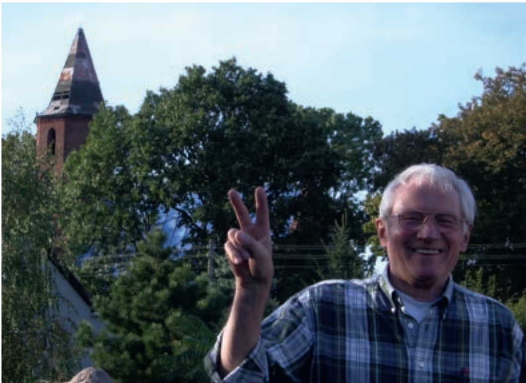
Kirche in Gnojau, 2009