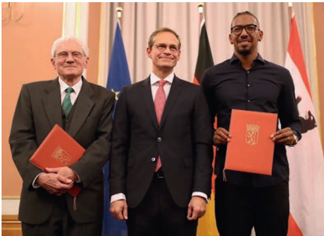
Verleihung der Moses-Mendelssohn-Preis, 2016